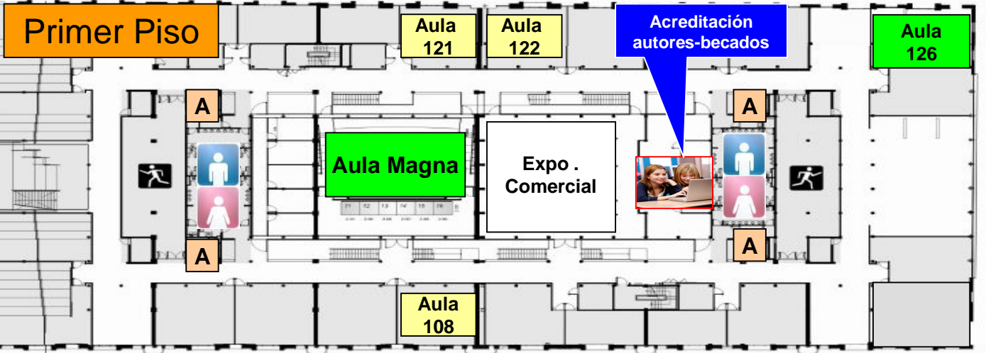
PRIMER PISO - UCA